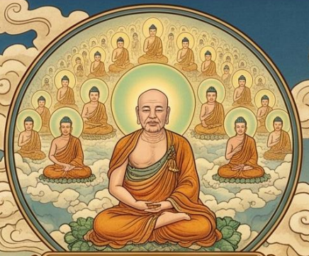
2. 曾見億百千佛 深心堅固