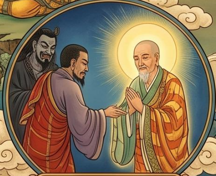
5. 捨惡知識 親近善友