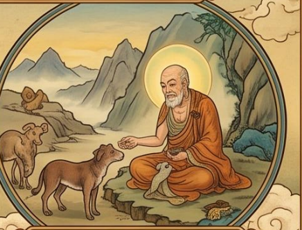
3. 精進常修慈心 不惜身命