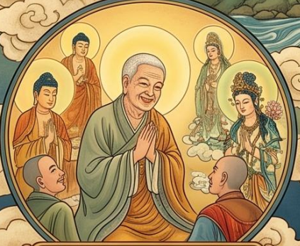
7. 無嗔質直柔軟 恭敬諸佛