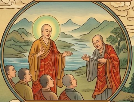
8. 於大眾中 說法無礙