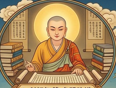
1. 利根智慧 多聞強識