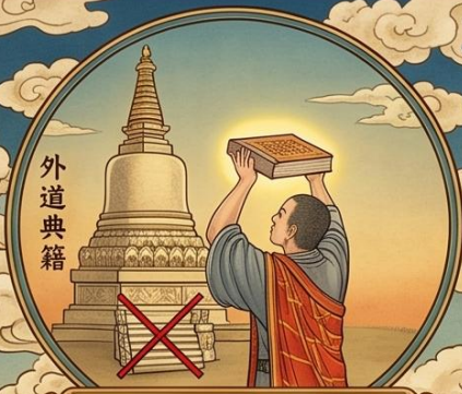
10. 至心求佛舍利 得已頂受