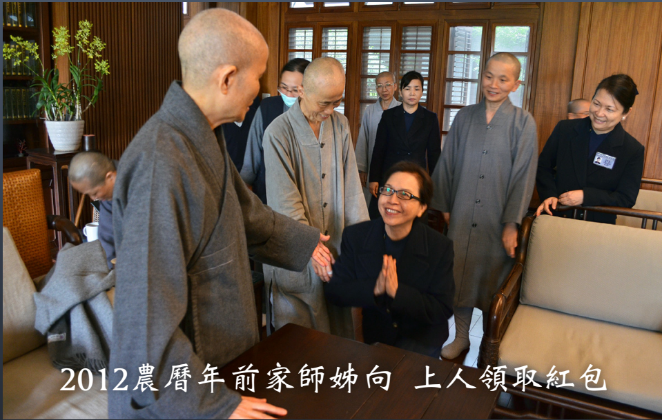
2012農曆年前家師姊向 上人領取紅包