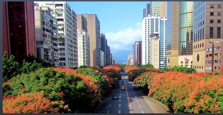
林蔭大道的敦化南路