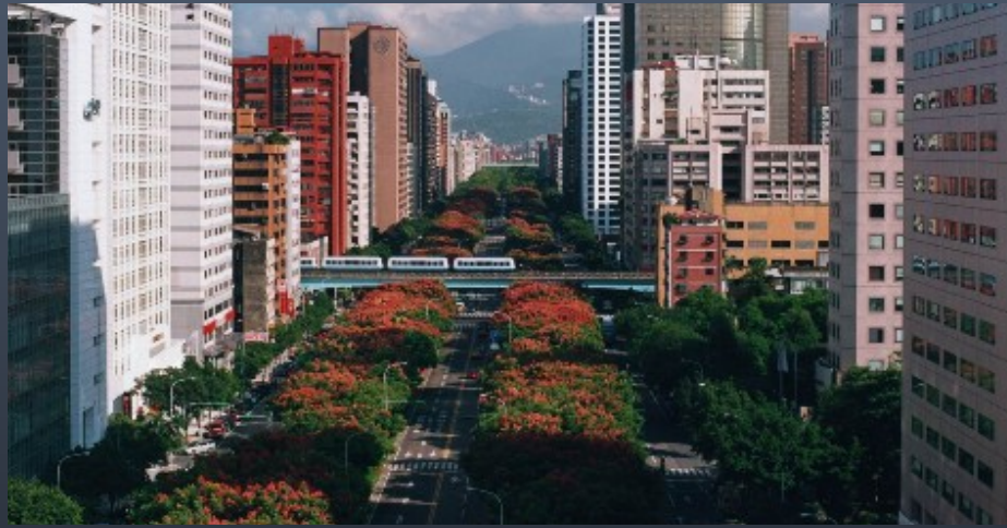
林蔭大道的仁愛路