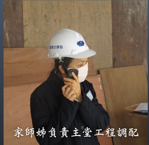
家師姊負責主堂工程調配