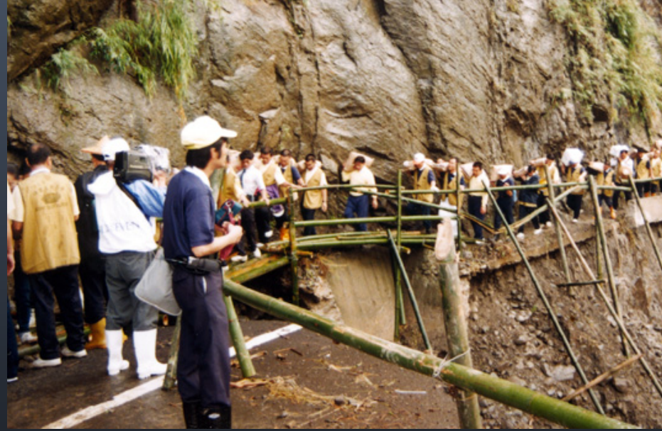
「莫拉克」風災慈濟志工走入了艱險的災區