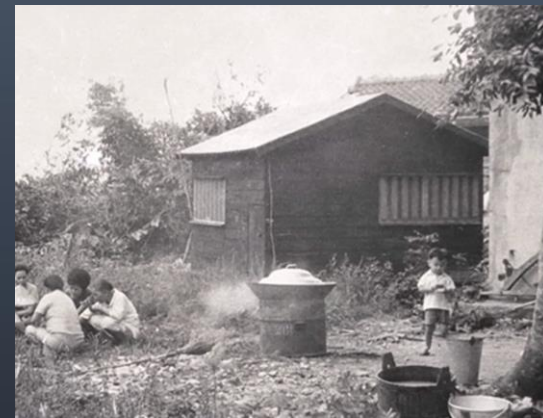
上人修行的「小木屋」

96年10月 上人慈示參予「主堂」的設計！.....回精舍那一天， 慈示小木屋「放光」的緣起：「師父在小木屋那段時間，每天研讀、禮拜、抄寫 《法華經》小木屋平常就會發光、發亮！但抄寫完回向給法界的那一天， 是農曆24日的凌晨，也就是藥師法會那天，小木屋就會大放光明， 發光發亮的 光芒 ！師父覺得不可思、不可議？.....」