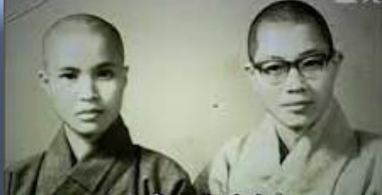
證嚴法師與修道法師