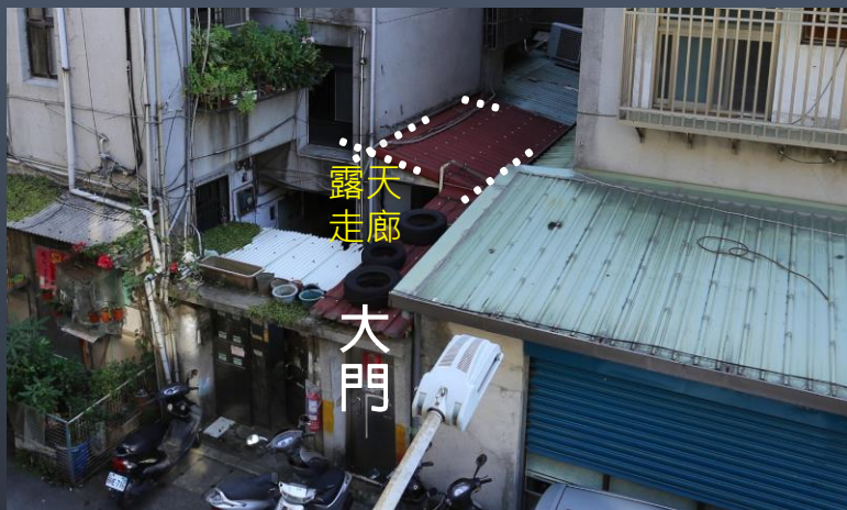
大樓之間夾縫的違建