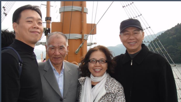
98年日本箱根溫泉之旅