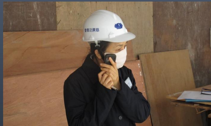
家師姊負責主堂工程

98年日本箱根溫泉之旅，一位長老與我、小兒子說了一段話： 「你們有因緣在花蓮造作寺院，不過當道場落成時，就是功德圓滿了...」