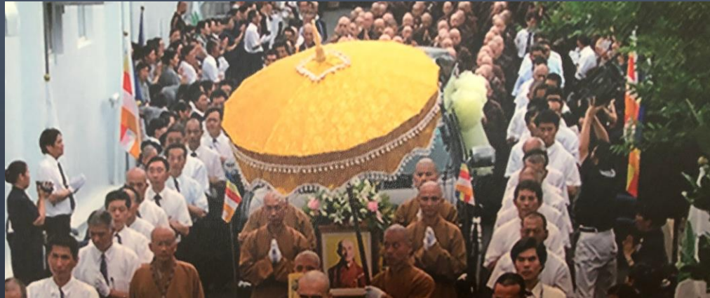
印順導師圓寂荼毗大典的「華蓋」

家師姊入院的第七天離開了人間.....那一天凌晨二點起床要讀誦《大悲咒》時，台籍看護師很慎重地對我說：「她的看護工作要做到今天！」為什麼呢？...「凌晨兩支雨傘「華蓋」，在師姊的頭上不停地打轉，讓她心裏非常害怕！...」