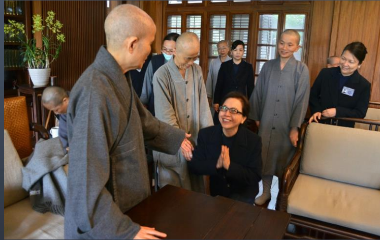
101農曆年前，家師姊向上人領取紅包

101年家師姊捨報人間前一個禮拜……有一天，家師姊身心充滿無量元氣……應是世俗所說「迴光返照」，元神已經要出竅了……那一天晚上八點多，上人請常住師父打電話來，未學手機已關靜音、睡著了……一連三天的來電；