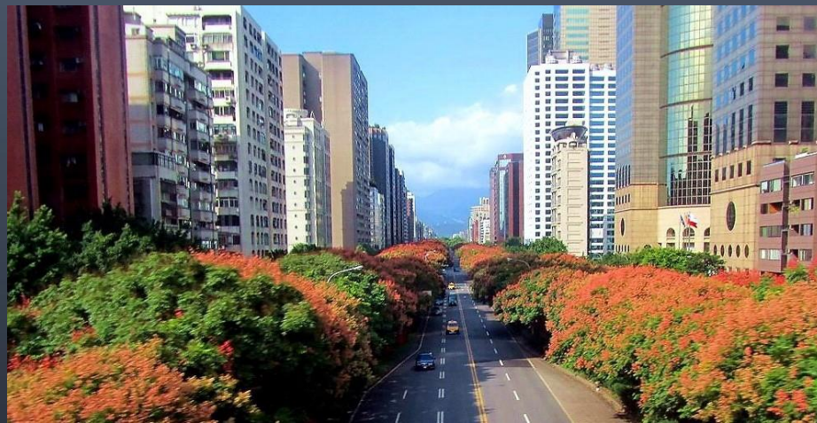
林蔭大道的敦化南路

61年白手起家的設計公司，是在大樓夾縫中的違建，四坪大小的空間..... 但一生最大的幸福，遇到了不貪圖錢財、富貴、名相.....又是書香門第的同學，在這麼簡陋的小違建，卻甘之如飴！違建的廚房呢？在 露天走廊 ，下雨必須撐傘，想起當年摯愛的委屈，挺著大肚子，如果沒有「 真愛 」，那能用傘撐起這個家！