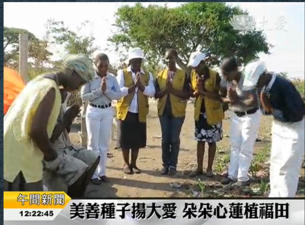
午間新聞 12:22:45 美善種子揚大愛 朵朵心蓮植福田