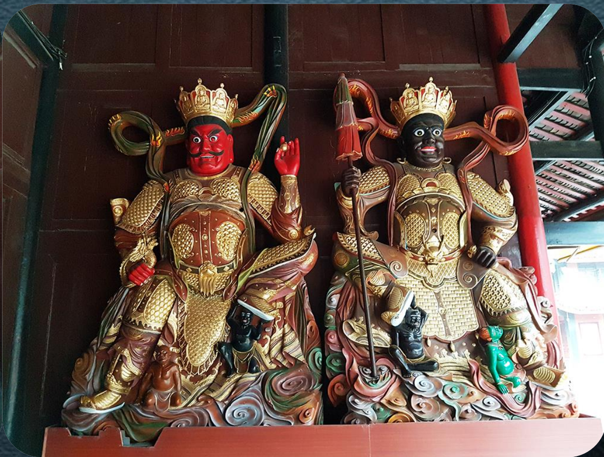
東方持國天王 南方增長天王 西方廣目天王 北方多聞天王 須彌山黃金埵 須彌山琉璃埵 須彌山白銀埵 須彌山水晶埵