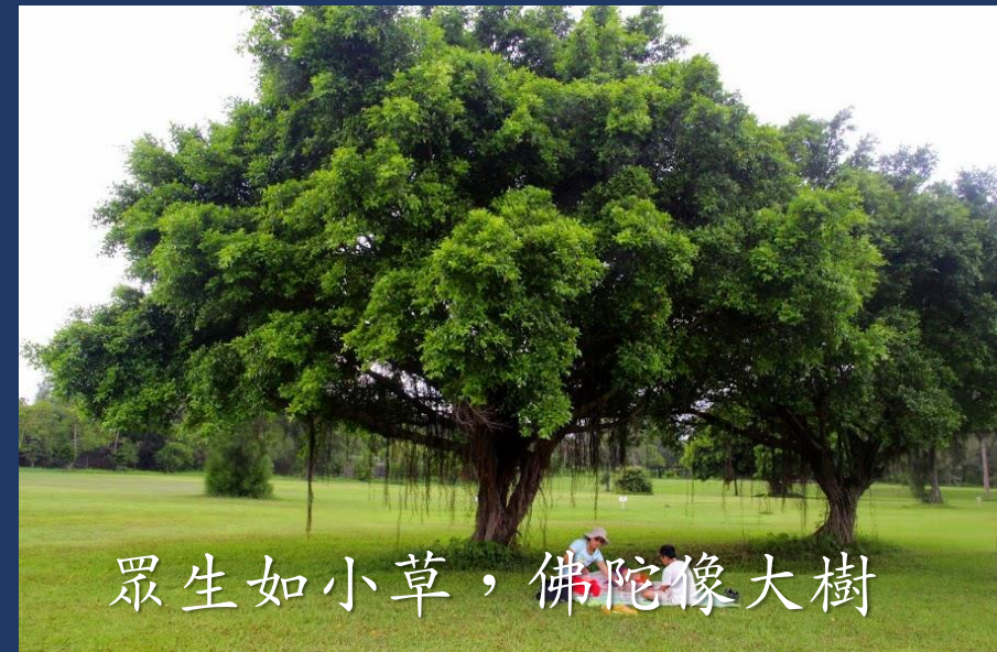
眾生如小草，佛陀像大樹