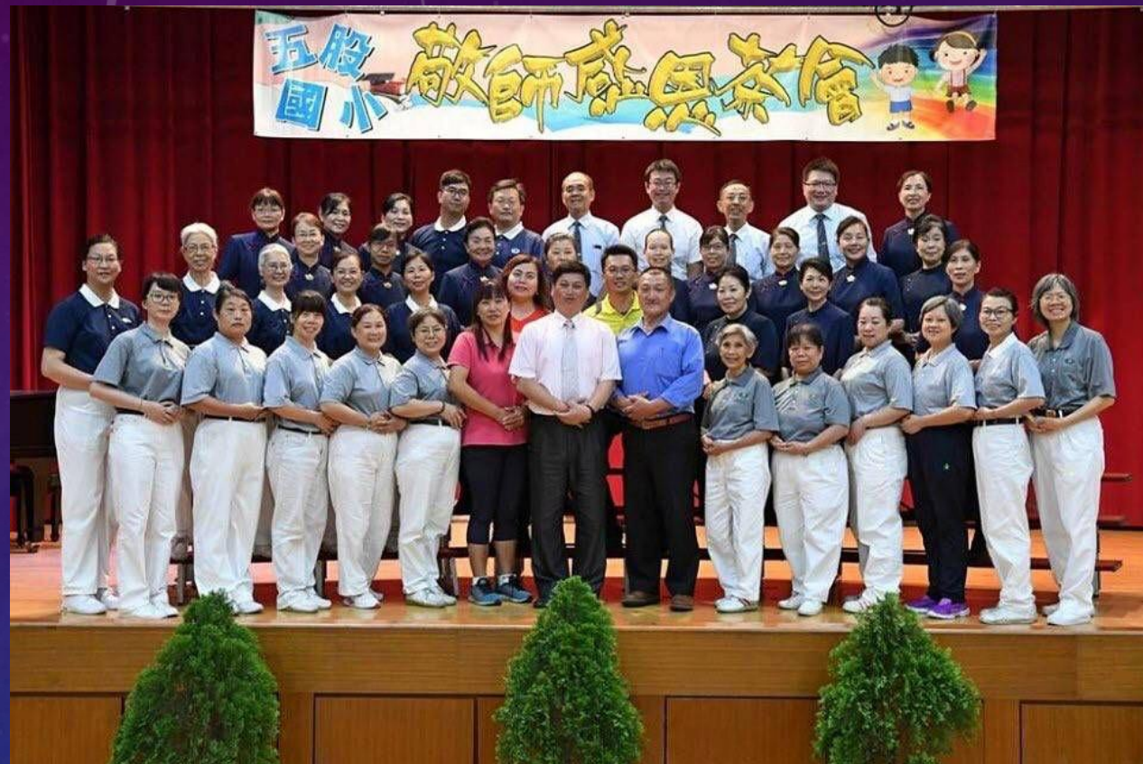
五股國小敬師茶會