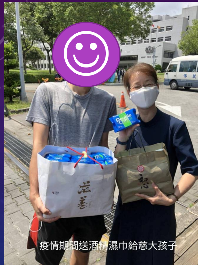
疫情期間送酒精濕巾給慈大孩子