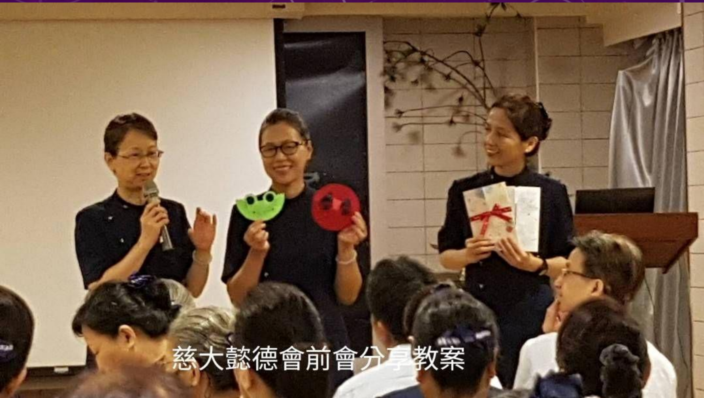
慈大懿德會前會分享教案