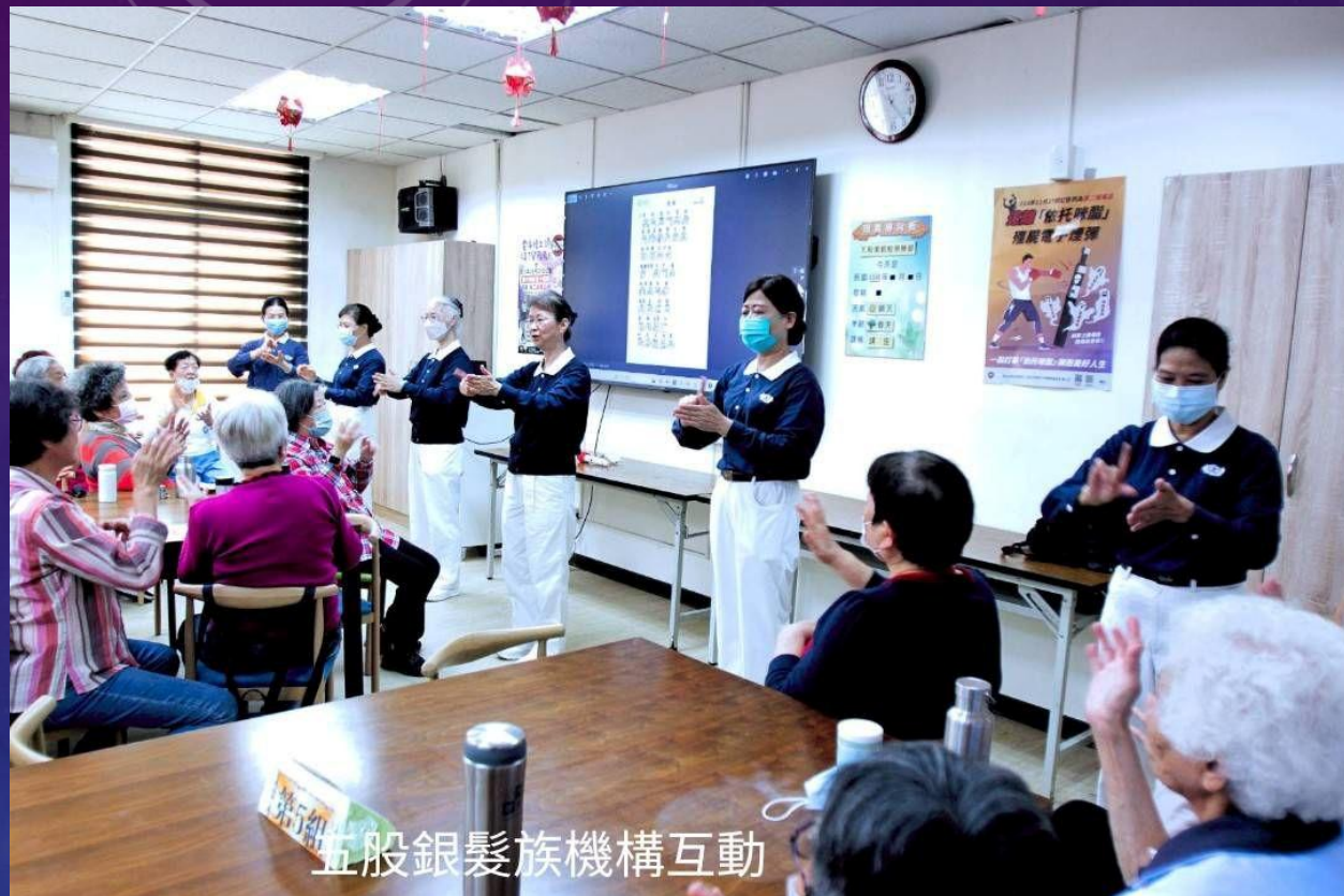
五股銀髮族機構互動