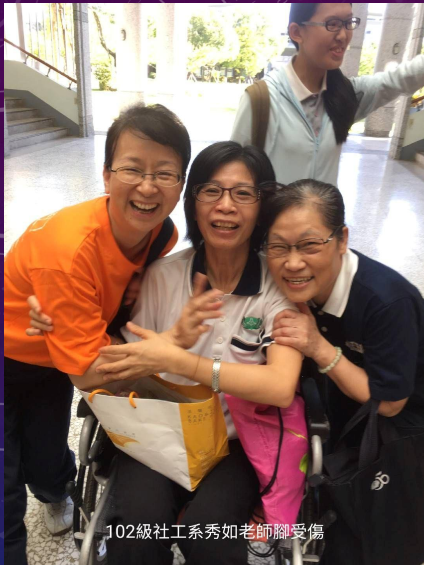
102級社工系秀如老師腳受傷