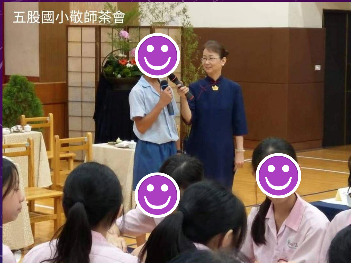
五股國小敬師茶會