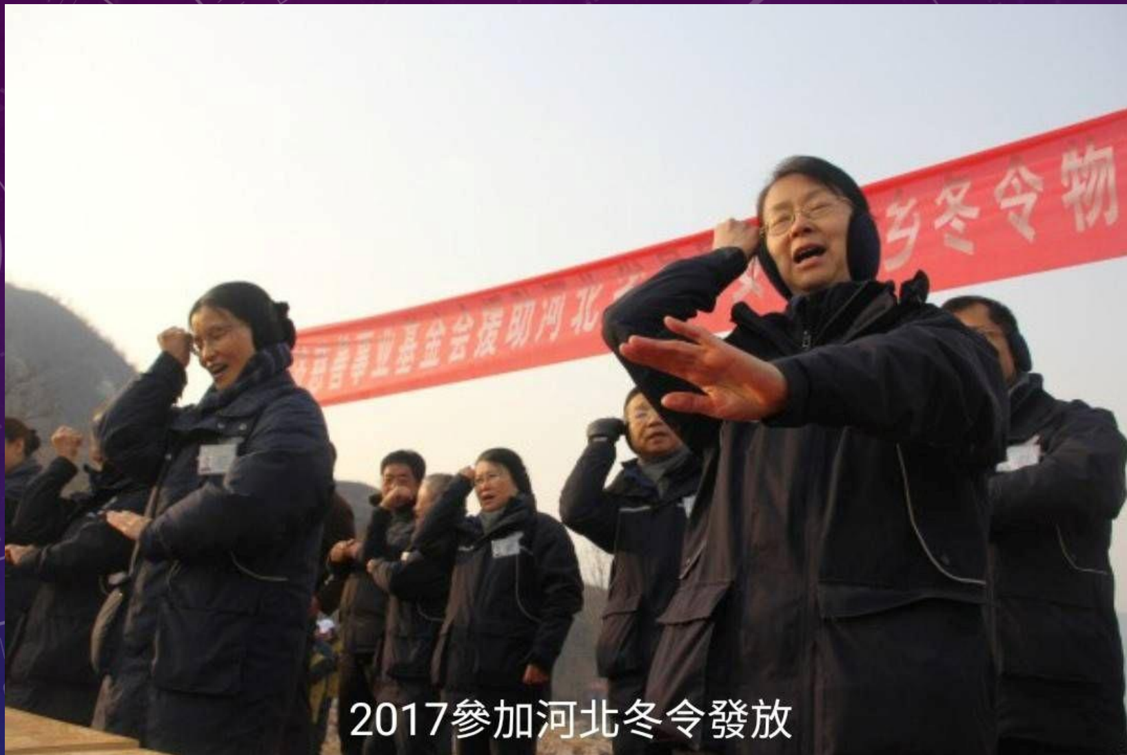
2017參加河北冬令發放