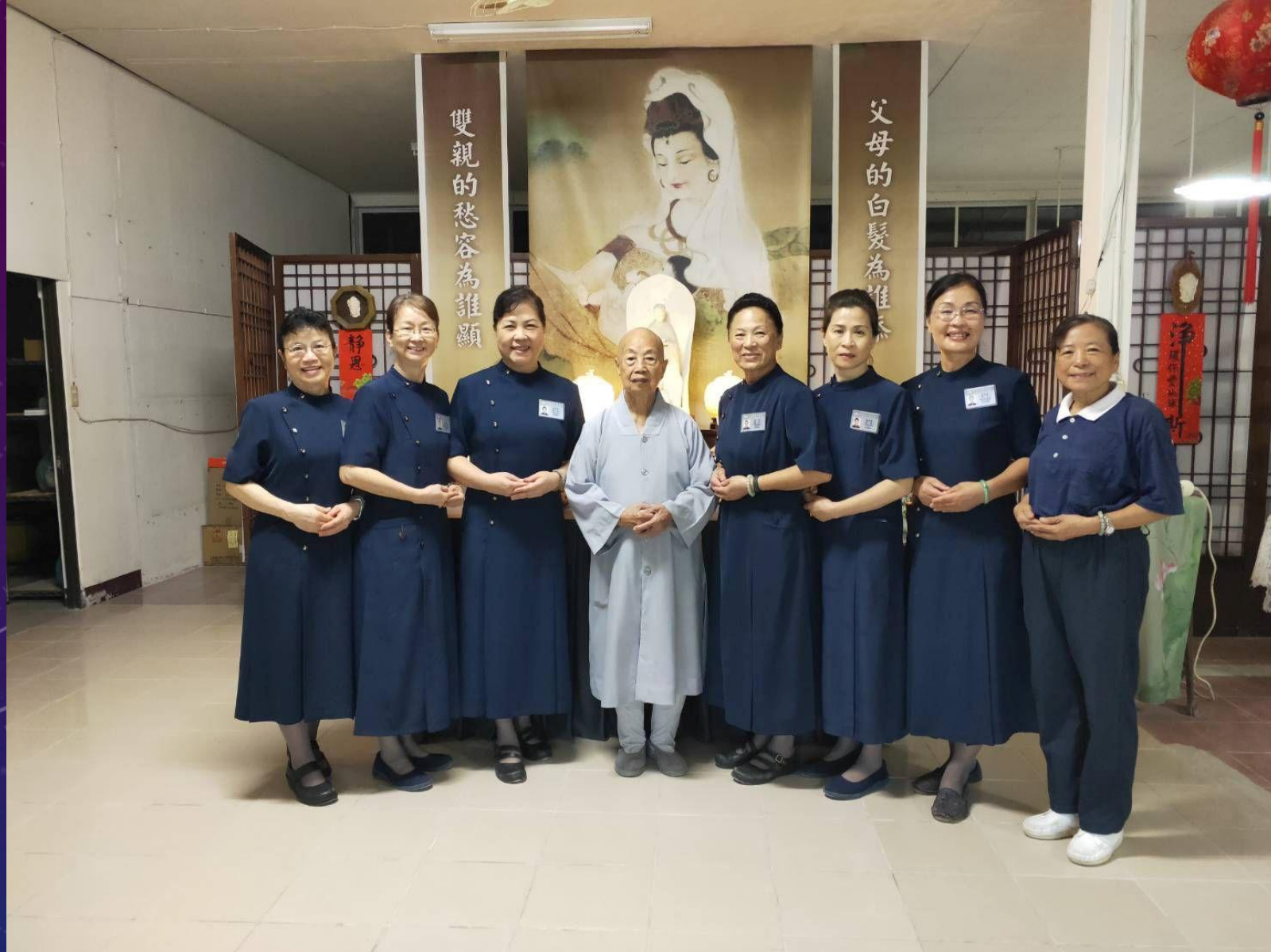
與慈師父珍貴留影