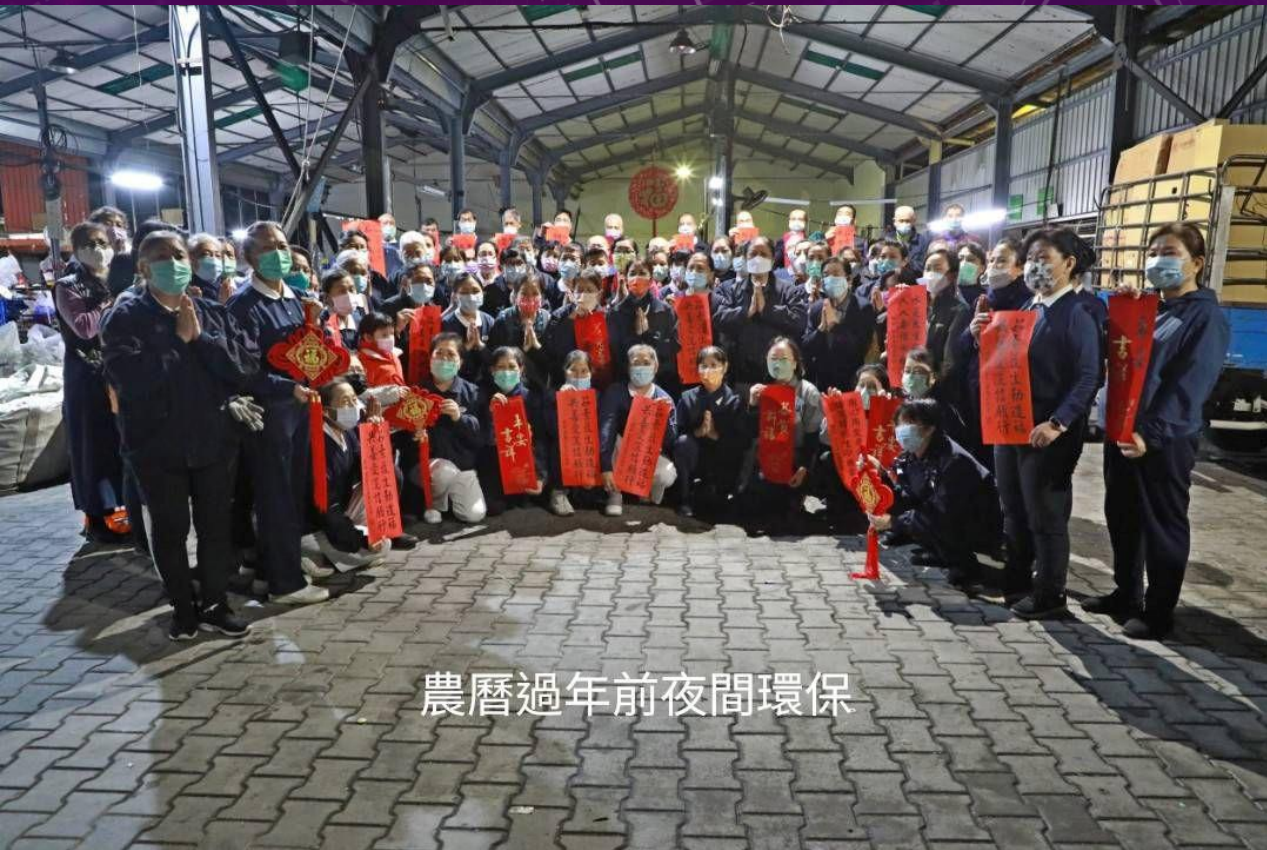
農曆過年前夜間環保