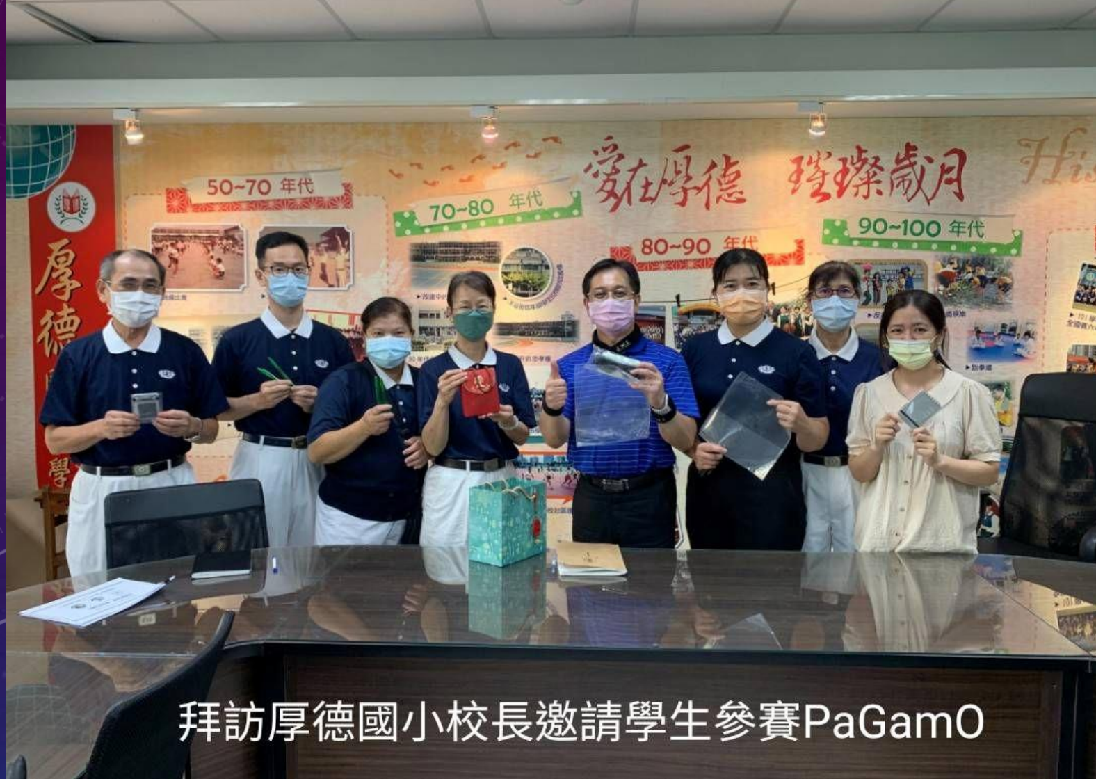
拜訪厚德國小校長邀請學生參賽PaGamO