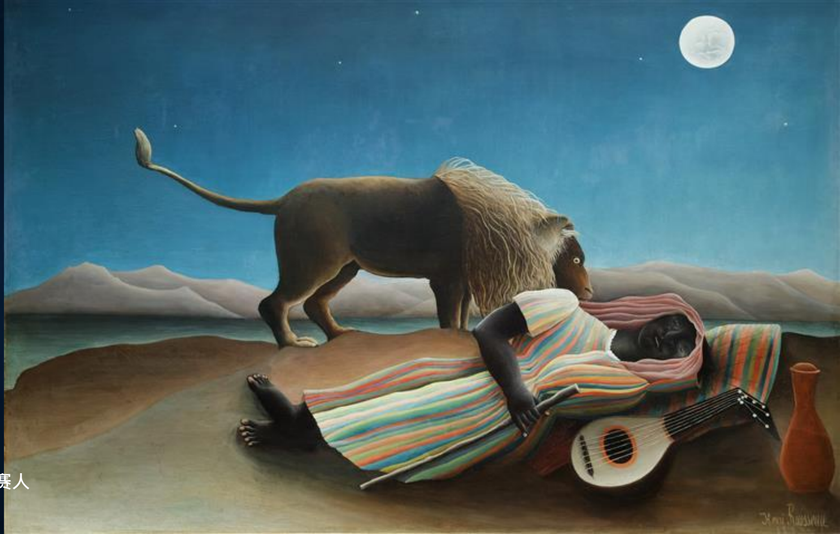
沉睡的吉普赛人 亨利·卢梭